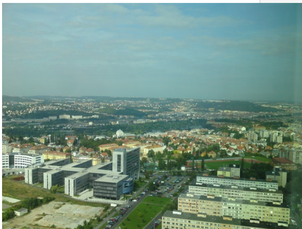
Výhled na Strahovskej kopec, zcela vpravo možno uvidět Hradčana.

Doma sem si odpočinul, poblahopřál si k tomu, že sem implementaci rsaček udělal dobře, že nikdo neprudí a tedka už mám zase mozkovou smrt. :)