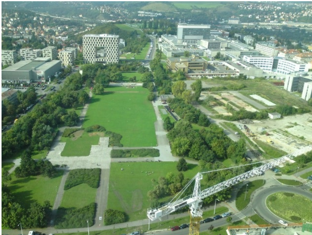
Pohled na pankráckou pláň, vpravo Kavčí hory a ČT, vlevo je moderní pražská architektura ve formě díry do prdele, vzadu hřiště na pozemcích čt, kde mají nějací pražští podnikatelé v plánu stavět baráky a místním se to moc nelíbí.