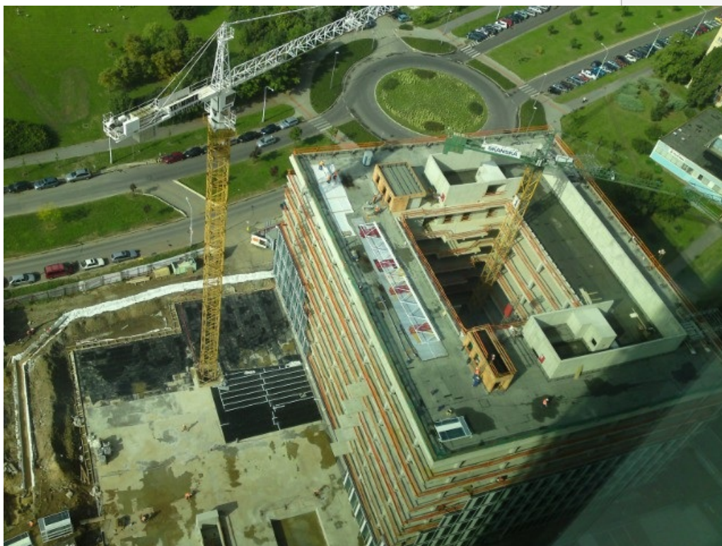
Pohled zezhora rovnou dolů.