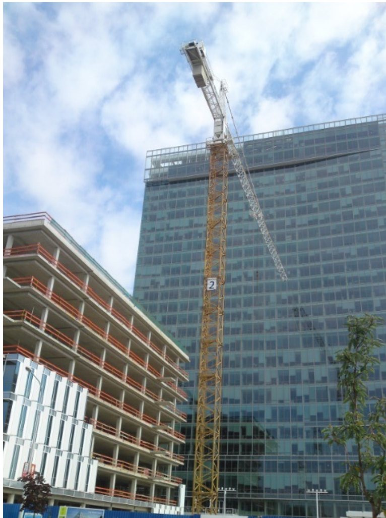
Pohled zezdola nahoru :)