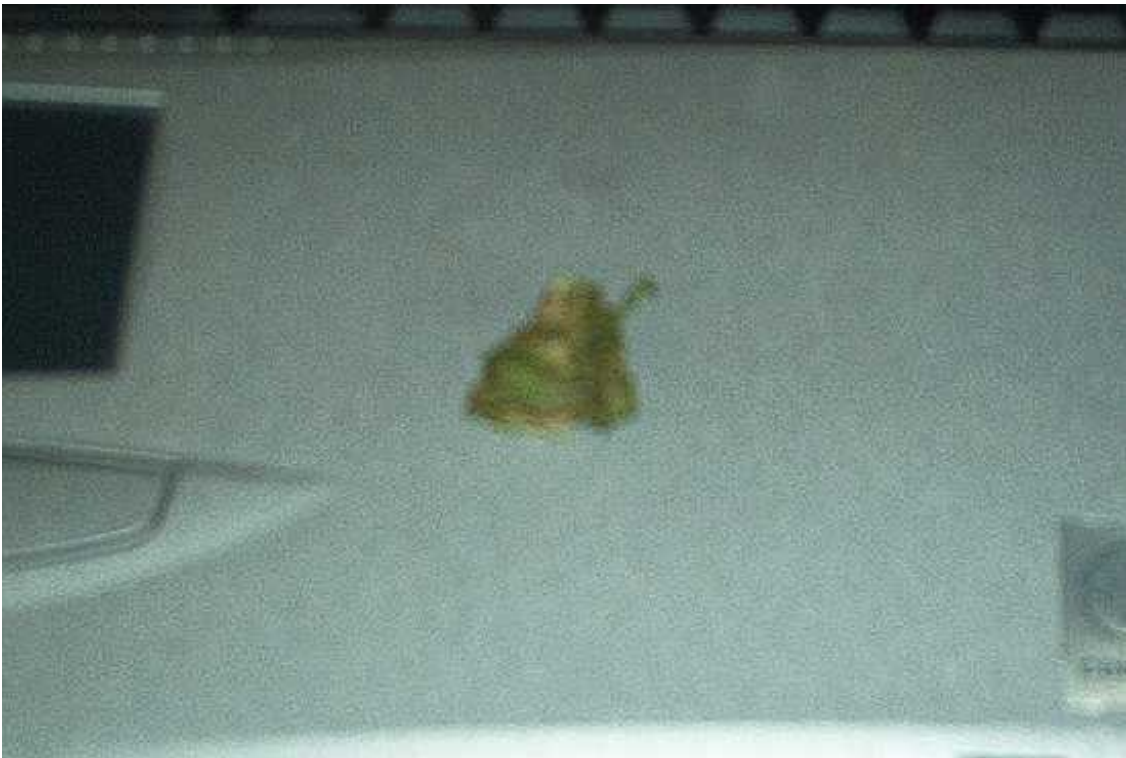
Máme matroš, samou radostí slzím a mám rozostřený zrak