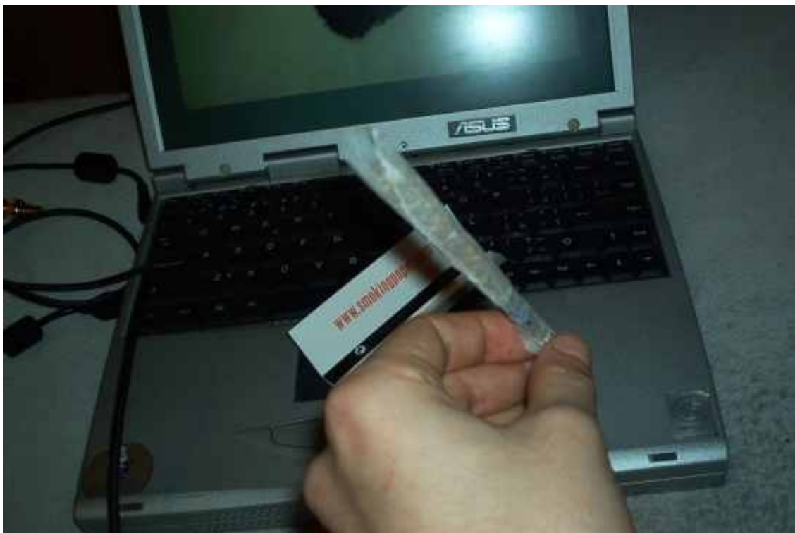
Transformace se podařila, jen sklepnout matroš, doladit esteticky...