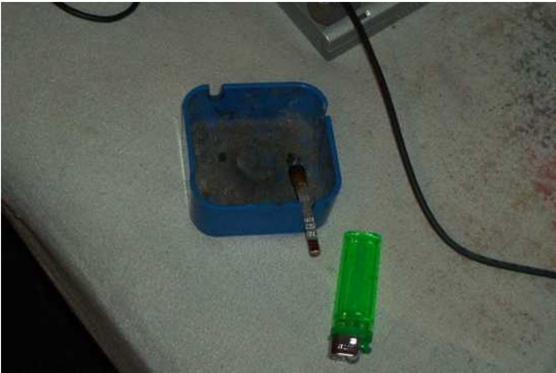
Džojnt na návštěvě u pana Popelníka

Nebo nám dokazuje, že ne všechno se může jevit jako to co si myslíte, že by to možná mohlo bejt, ale třeba si nejste jistí tím, čím si myslíte, že si ste jistí. A nejistota je to jedno, čím ste si jistý. To je jistý.