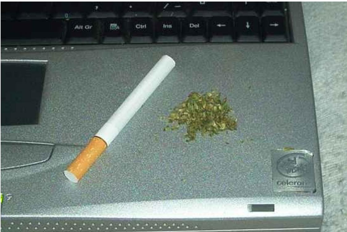
Materiál nadrtíme a připravíme si cigo. Nástávajícího potomka si zatím držíme v hlavě