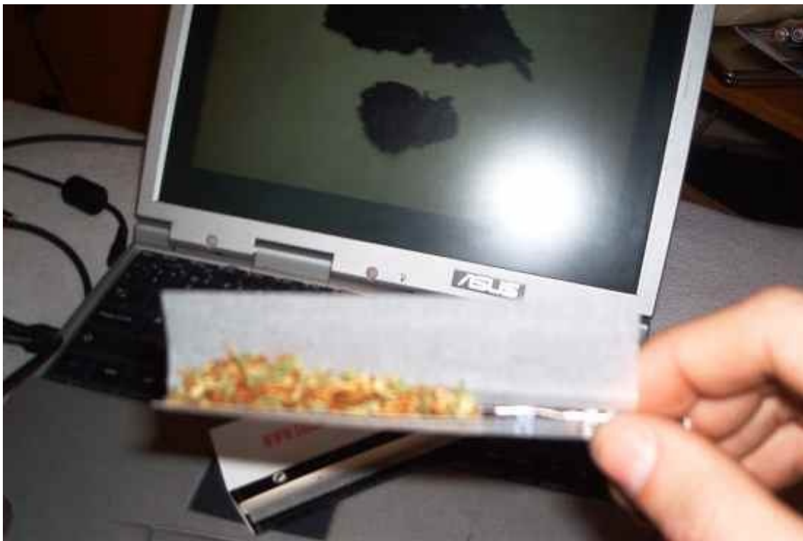
Důležitá fáze... pokus o spojení tří, zdánlivě, nesourodých materiálů v jeden celek.