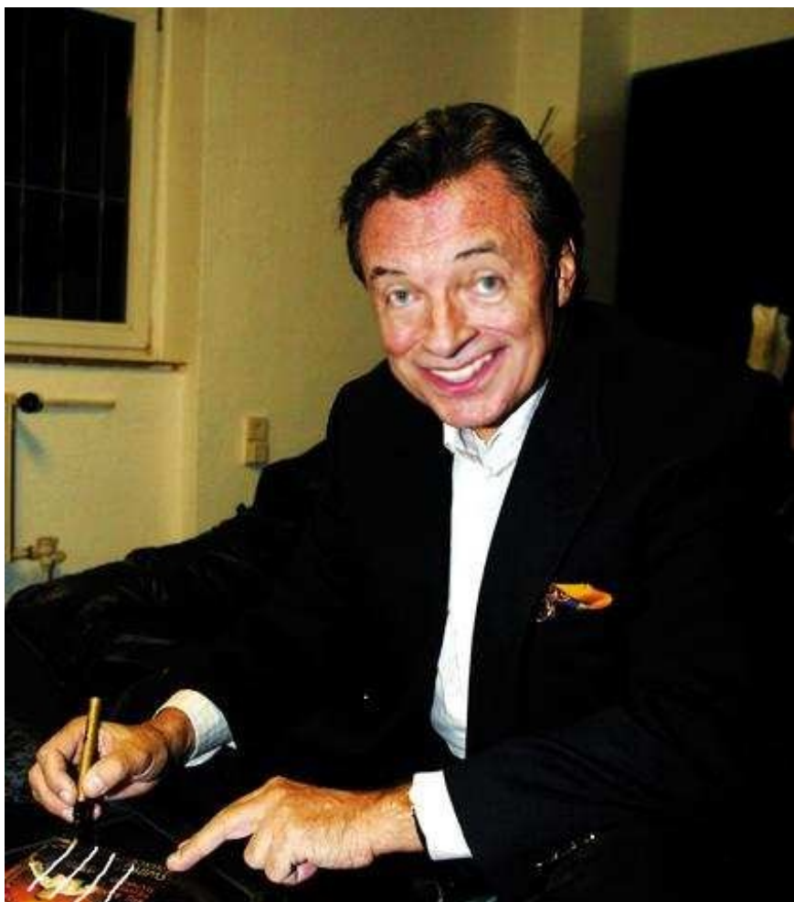
Karel Gott for president!!!!

Podporuji kandidaturu Karla Gotta na prezidenta České republiky. Karel Gott je oblíbený mezi lidmi. Je vhodný pro jakýkoliv režim, nefetuje, něco umí a má dobré vztahy s Rakouskem, Německem a Ruskem. Byl by to úplně dokonalý prezident. Karel Gott na HRAD! Venku sněží. Jo, když nejde vo život, de vo howno.