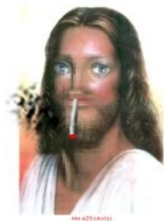
Ježíši Kriste, nehul tolik.

Tento a jiné jemu podobné rachotické texty najdete tady na tom odkazu . Je to fakt hustý jaxvině.